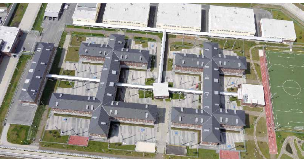
Die Justizvollzugsanstalt (JVA) Wuppertal-Ronsdorf ist eine Anstalt des geschlossenen Jugendstrafvollzuges für männliche Untersuchungs- und Strafgefangene.

JVA Wuppertal-Ronsdorf – seit Sommer 2011 betreibt die neue Justizvollzugsanstalt in Wuppertal, der größten Stadt im Bergischen Land, modernen Jugendstrafvollzug für männliche Untersuchungs- und Strafgefangene. Innerhalb von nur zwei Jahren nach Grundsteinlegung entstand auf rund 100.000 m 2 eines ehemaligen Bundeswehrgeländes ein neuer Gebäudekomplex mit insgesamt 510 Haftplätzen. Umfassende Kommunikations- und Sicherheitstechnik bilden dabei die Grundlage für den sicheren Betrieb in der JVA. Als Brandschutz- und Sicherheitsspezialist sowie Systemintegrator zugleich übernahm Tyco Integrated Fire & Security dabei federführend die komplette Ausrüstung der neuen Gebäude mit Schwachstromtechnik.