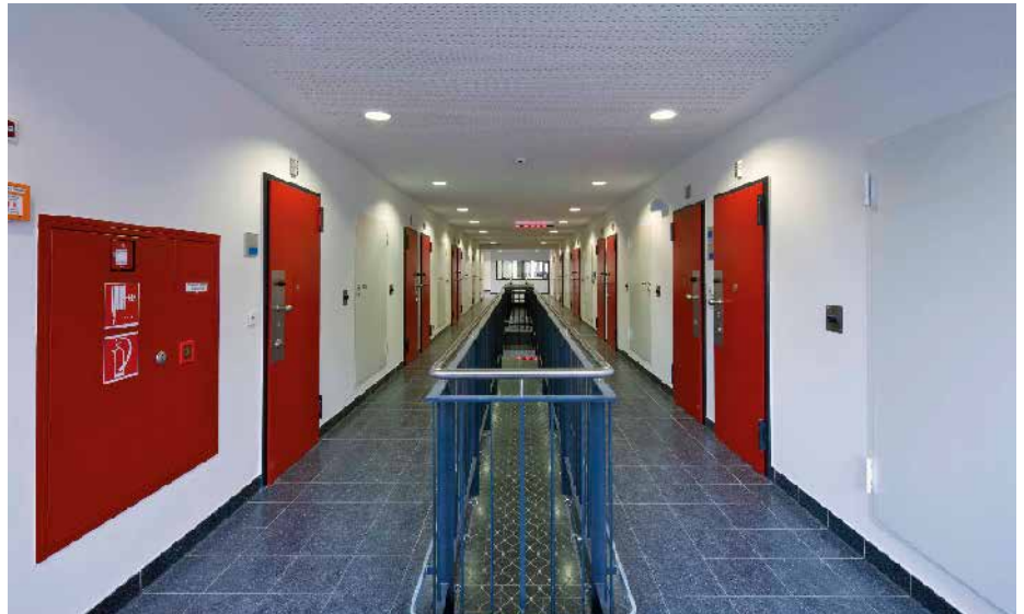
Innenansicht eines Zellengangs

Zudem wird der Publikumsverkehr intensiv überwacht und kontrolliert: Schrankenanlagen, Zutrittskontroll-systeme, Schleusensysteme sowie Röntgenscanner und Metalldetektoren sorgen dafür, dass Personen weder unberechtigt in die oder aus der JVA gelangen oder zum Beispiel Waffen