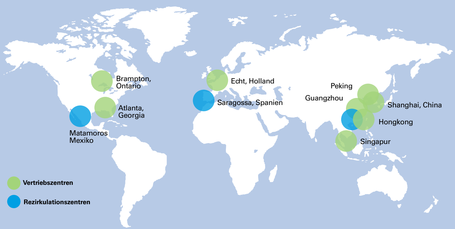
Abbildung 2 Tyco Hartetiketten Vertriebs- und Rezirkulationszentren – Standorte und Abdeckung sind bezüglich Zeitzonen, Geschäftssprachen, Versandrouten und Expansionsmöglichkeiten optimiert.